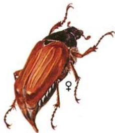
Feldmaikäfer Melolontha melolontha

Unterscheidungsmerkmale der Engerlinge: Borstenfeld u. Dörnchenreihe (vergrössert)