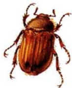
Junikäfer Amphimallon solstitiale