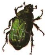
Gemeiner Rosenkäfer Cetonea aurata