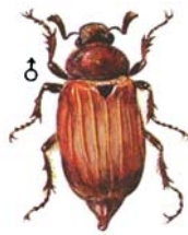
Waldmaikäfer Melolontha hippocastani